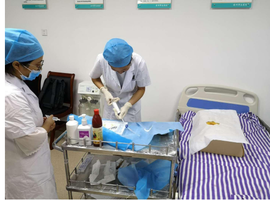
基地临床技能中心内景