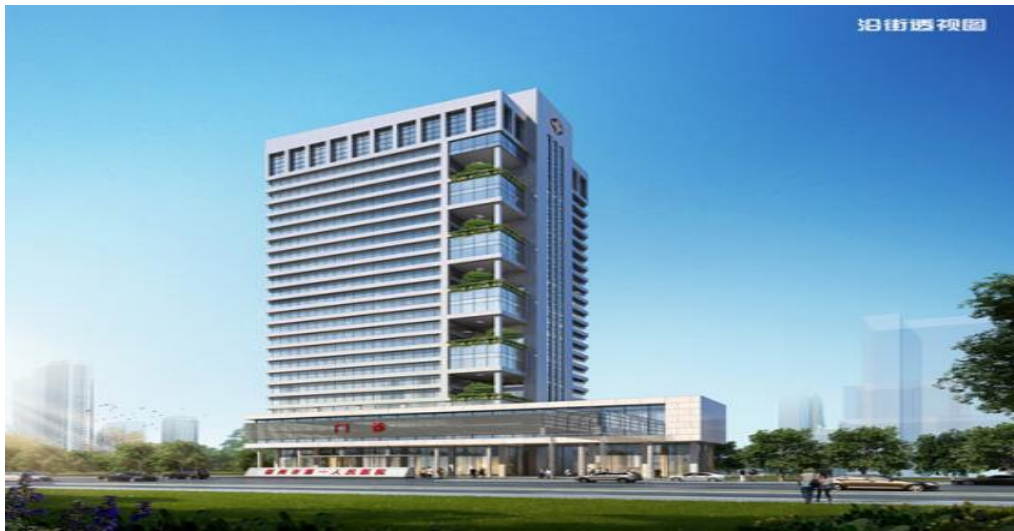
新建 23 层门诊病房综合楼

医院北院区和南院区现阶段共占地 2.7 万平方米，建筑面积 7.7 万平方米，另外还有一栋建筑面积为 4.6 万平方米的综合大楼正在建设，未来将投入使用。医院现有开放床位 1000 张，在职职工 1595 人，其中高级职称 138 人，中级职称 533 人。设有 42 个临床科室，20 个医技科室，医院普外科为安徽省省级重点专科，心血管内科、消化内科、重症医学科、神经内科、泌尿外科、麻醉科为宿州市市级重点学科；普外科、内分泌科为宿州市临床特色专科。