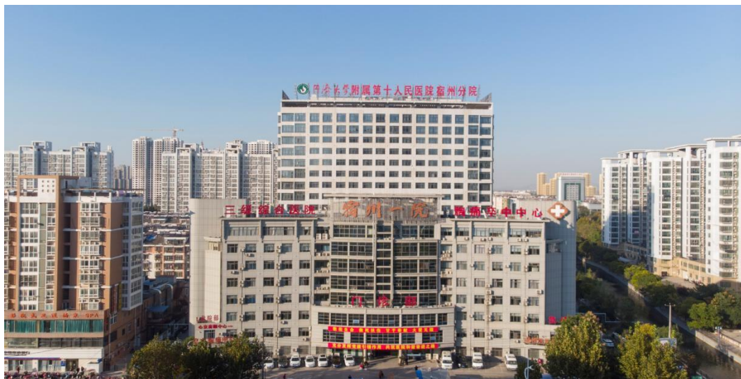
宿州市第一人民医院

宿州市第一人民医院又名同济大学附属上海市第十人民医院宿州分院，皖北卫生职业学院附属医院。前身是宿县人民医院，建院于1961年，目前是一所集医疗、教学、科研、预防、急救、康复、健康促进为一体的区属三级公立综合医院。是国家爱婴医院、全国70佳百姓放心示范医院、全国综合医院中医药工作示范单位、国家级节约型公共机构示范单位、国家级胸痛中心、国家级示范卒中防治中心、中国创伤救治联盟创伤救治中心建设单位、国家5G移动卒中救治体系建设与应用试点工程合作单位、长三角中医药专家团宿州工作站、安徽省健康促进医院、安徽省住院医师规范化培训基地协同单位。