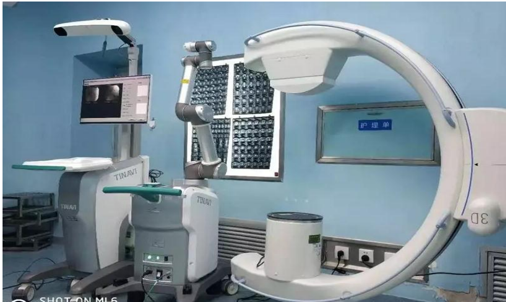
骨科手术天玑机器人