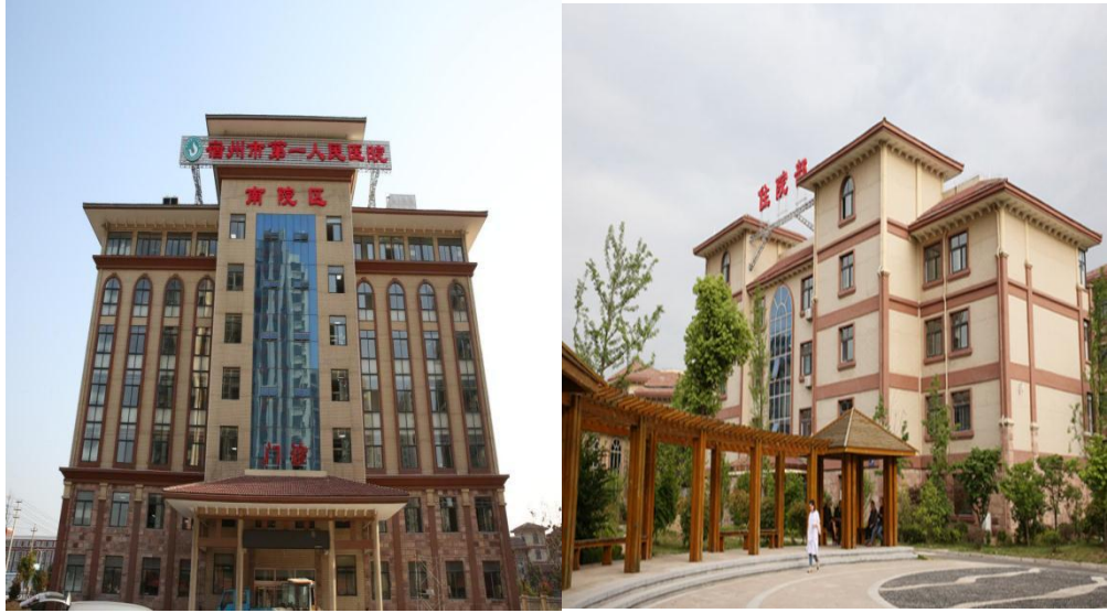
宿州市第一人民医院南院区